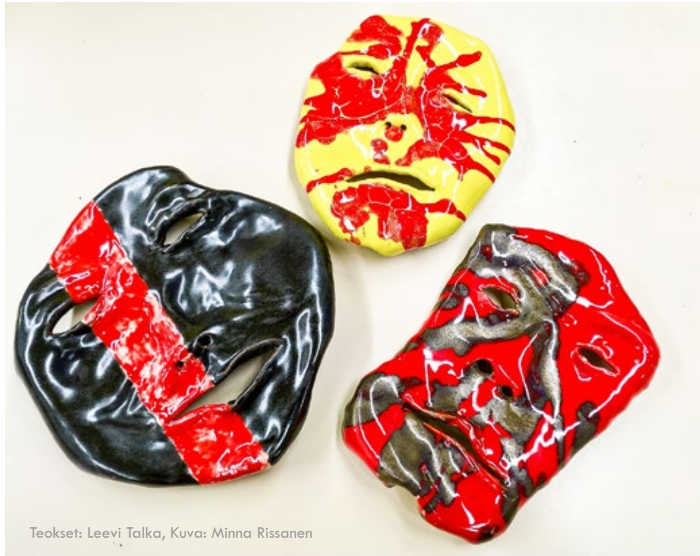
Teokset: Leevi Talka

Kouvolan kansalaisopistossa varhaisiän kuvataidekasvatus tapahtuu taiteen perusopetukseen valmistavina opintoina. Valmistavissa opinnoissa tutustutaan visuaaliseen kulttuuriin ja sen toimintatapoihin lapsen omaa elämämaailmaa hyödyntäen. Työskentely on lei-